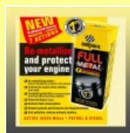
BARDAHL "FULL METAL" LONGLIFE- Ölbehandlung 400 ml